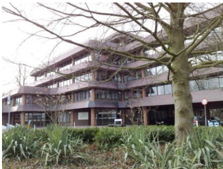
Gemeentehuis Rheden te De Steeg

Evenals in 2016 is in 2017 de gemeente Rheden de grootste subsidient. De gemeente Rozendaal draagt middels een afgesproken verdeelsleutel bij. Beide subsidienten en het bestuur van de stichting stemmen dit in goed overleg met elkaar af. Als onderbouwing van de subsidie ligt het beleidsplan.