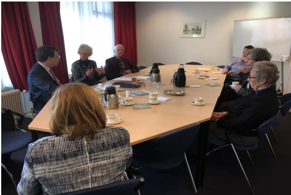
Links de heer Van der Linden in gesprek met coördinator.

Tijdens een bijeenkomst van senioren in Den Haag is er nl. gesproken over: hoe kunnen ouderen zolang mogelijk in hun eigen omgeving blijven wonen. Tijdens de discussie hierover is er gewezen op het Rhedense project Mijn Huis Mijn Toekomst. Tweede Kamer lid de heer Roald van der Linden vond dit zo interessant dat hij er graag meer over wilde weten. Hij is hiervoor naar Velp gekomen om samen met huisbezoekconsulent een kijkje gaan nemen; ook is hij bij een senior op bezoek geweest die een aanvraag had ingediend.