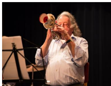
Trompettist van het Jazzorkest

Totale ureninzet in 2017 door de vrijwilligers van het Comité Dag van de Ouderen ongeveer 300 uur.